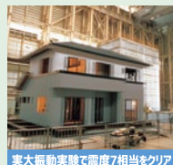
実大振動実験で震度7相当をクリア