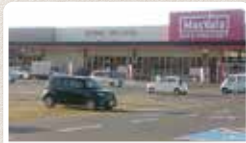
イオンタウンまで約750m