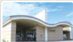
ひめじ別所駅まで約960m