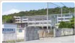
別所小学校まで約1,200m