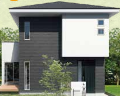
※パースはイメージです。

・当店で新型コロナウイルスの感染予防策としてお客様と従業員の健康と 安全確保を考慮し、マスク・手袋着用・換気の徹底を実施しています。