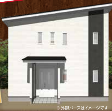
※外観パースはイメージです

※ウッドショックによる木材価格の高騰により、材木費別途40万円がかかります。 ※その他フリープランでもキャンペーン価格のお申込が可能です。 詳しくは明治住建ひめじ別所モデルハウスまでお問い合わせください!!